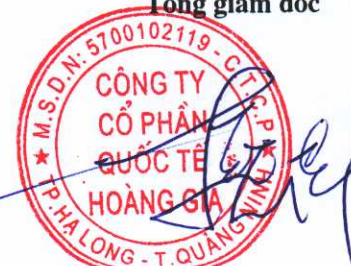
Đỗ Trí Vỹ