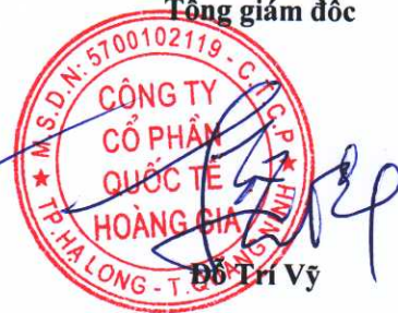
Đỗ Trí Vỹ